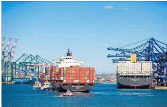
El comportamiento de los flujos y precios de carga que salen desde Asia al resto del mundo, especialmente a Estados Unidos, dicta el comportamiento del costo en América Latina, indican en el sector.

El documento indica que a mediados del ejercicio pasado se había observado una incipiente tendencia a la baja en los valores, que se vio interrumpida a partir de julio a consecuencia del aumento en los costos de la carga desde China. En septiembre de 2022, el precio llegó a su máximo histórico de US$ 336 por tonelada, más que cuadruplicando los niveles observados en los meses previos a la pandemia, es decir, inicios de 2020. En tanto, a diciembre de 2022, se previó un retroceso a US$ 210 por tonelada. Pese a esta disminución, los costos promedio del transporte naviero de importación aún se mantienen casi tres veces más altos que los registros previos a la pandemia", indica el informe. De hecho, al analizar todo 2022, la tarifa promedio anual de carga general se incrementó 38% respecto al promedio de 2021, afir-